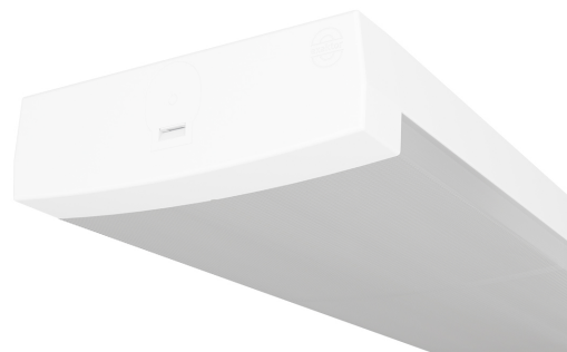
ON/OFF KIT Naiad G4